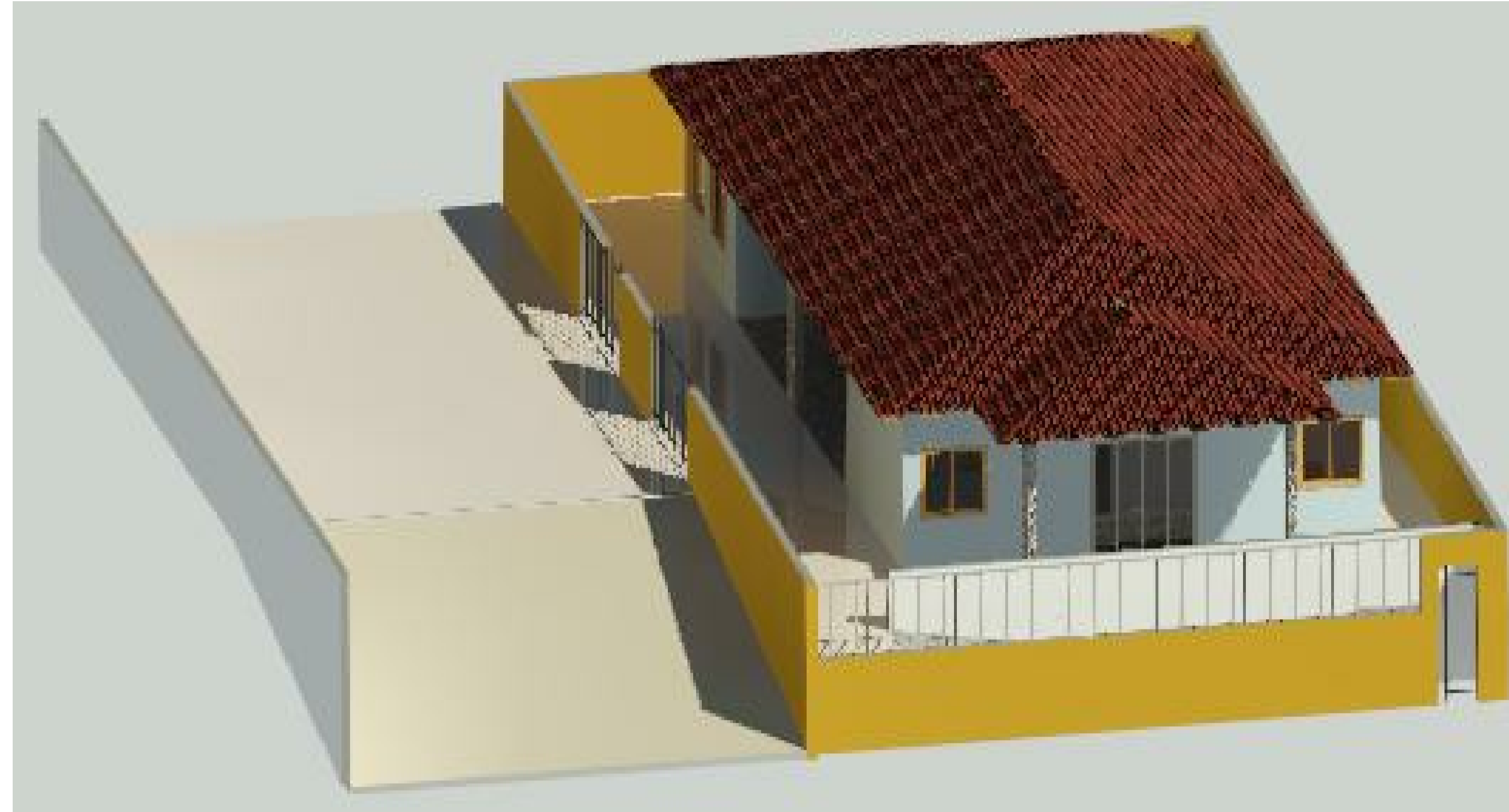
MURO II 1:1