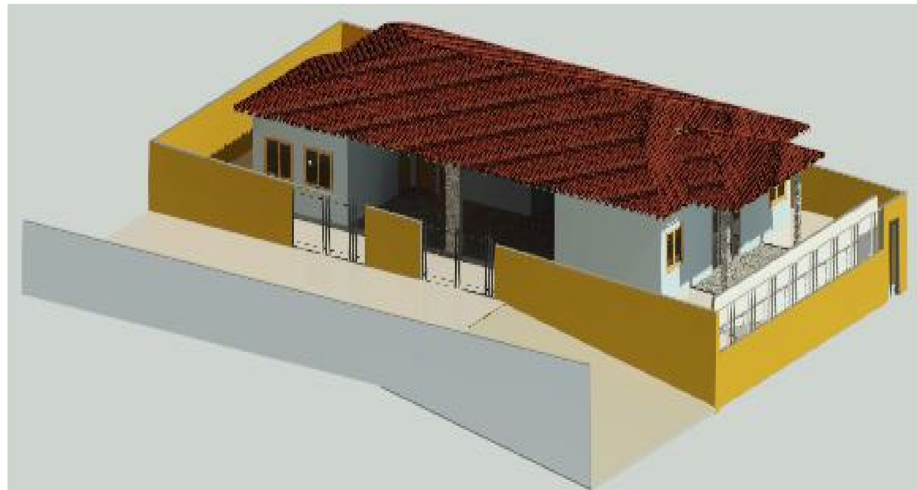
MURO IV 1:1