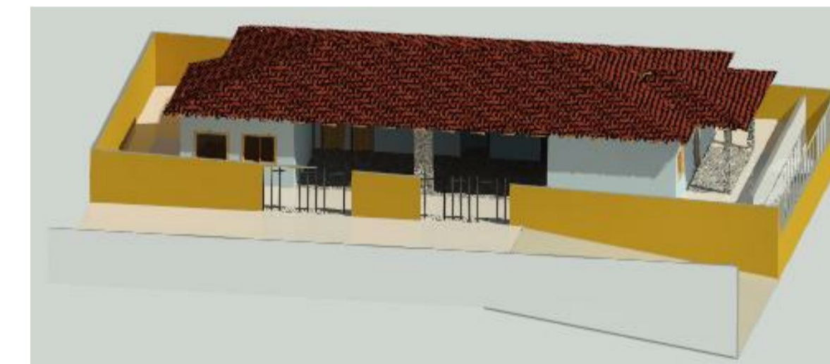
MURO V 1:1