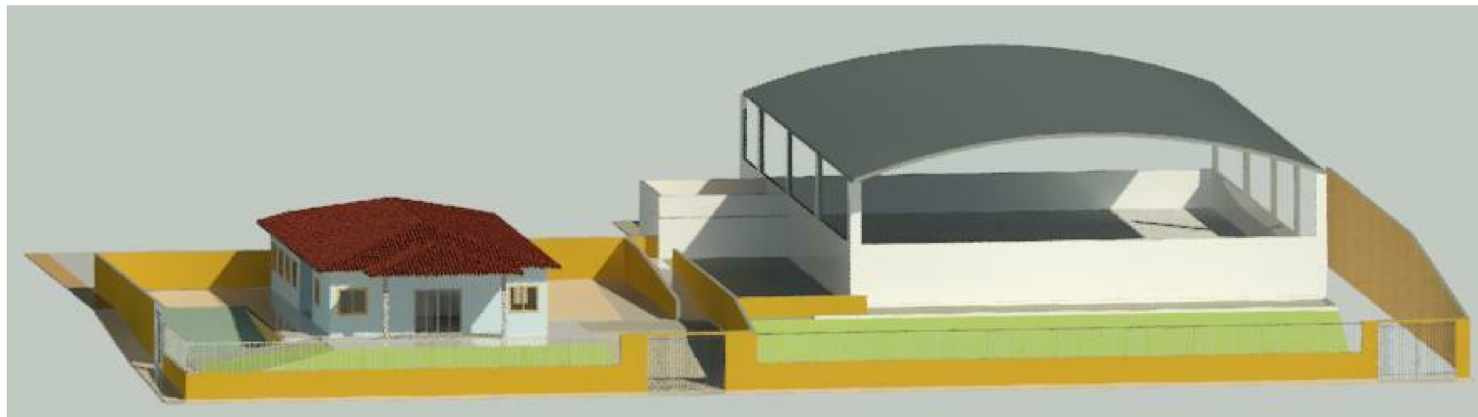
Elevação II 1:1