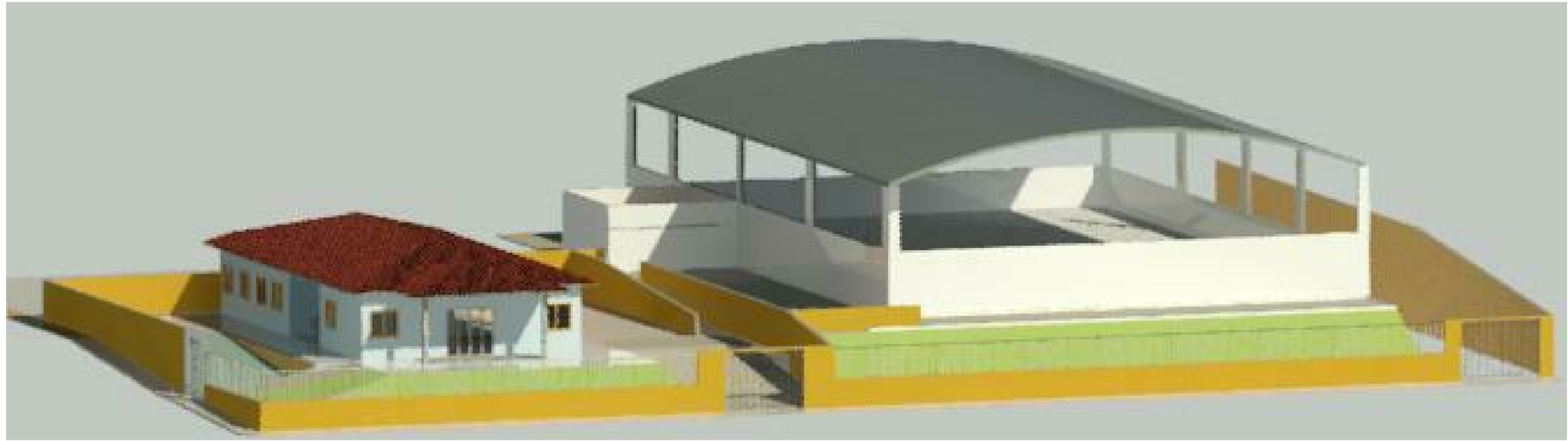
Elevação I 1:1