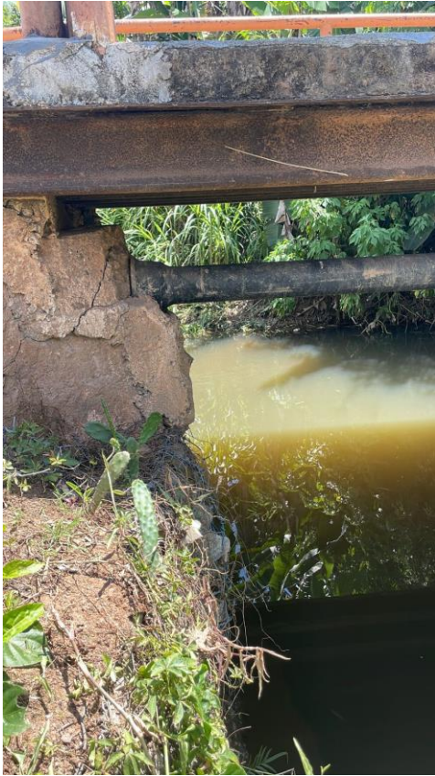
Descrição: Danos Ala