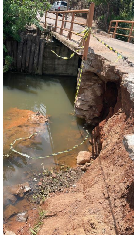
Descrição: Danos Ala