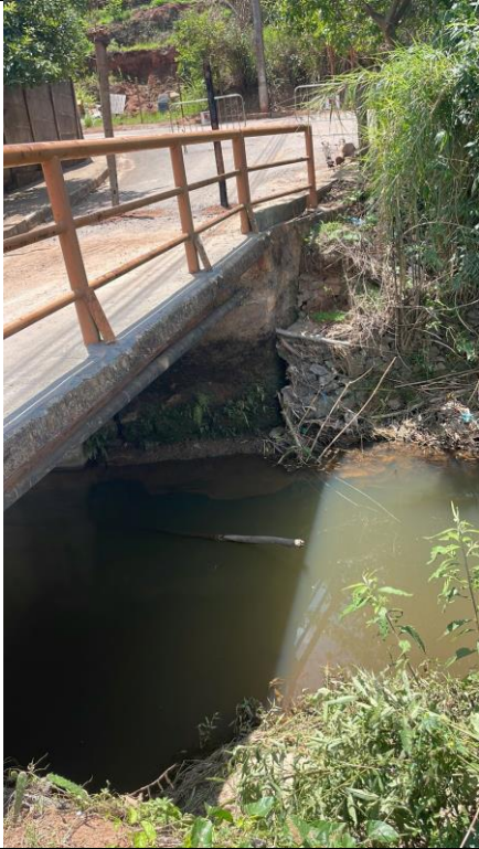
Descrição: Danos Ala