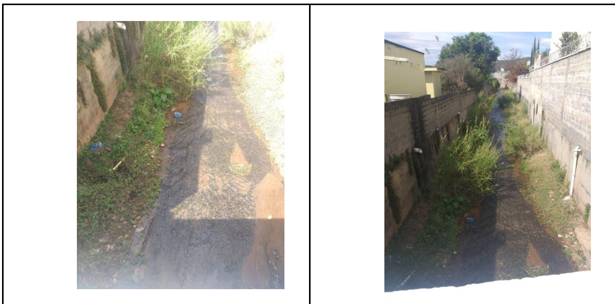
Figura 3 - Fotos do trecho concretado do Rio Vermelho

O trecho concretado possui comprimento de 200 m e largura de 4 m (Figura 3).