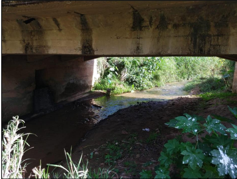
Figura 4 - Ponte no trecho do Rio Vermelho e banco de areia

Ao longo do percurso, há presença de duas pontes, com altura de aproximadamente 2 metros, debaixo das quais o maquinário deverá passar para realizar a limpeza (Figura 4).