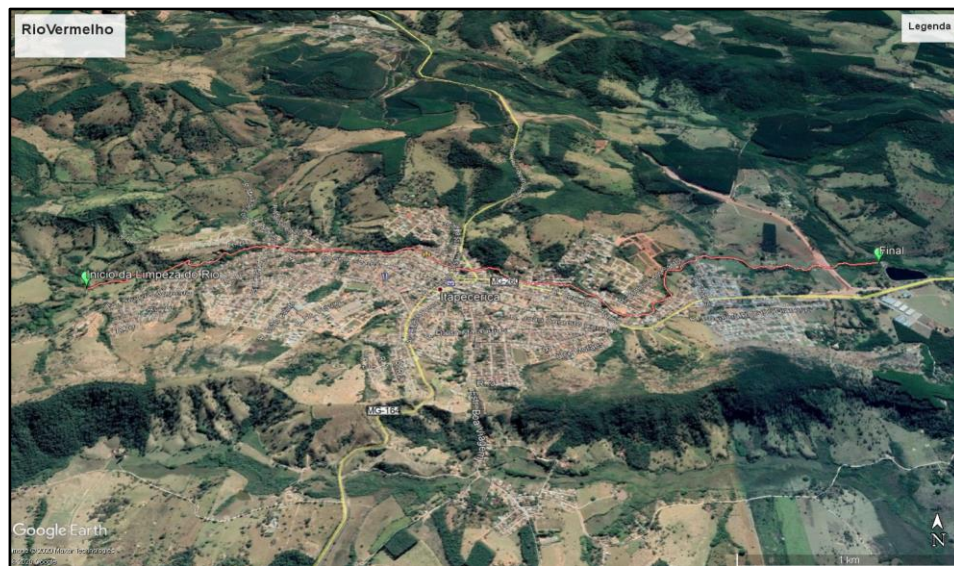
Figura 1 - Trecho urbano do Rio Vermelho onde devem ser realizados os serviços especificados.