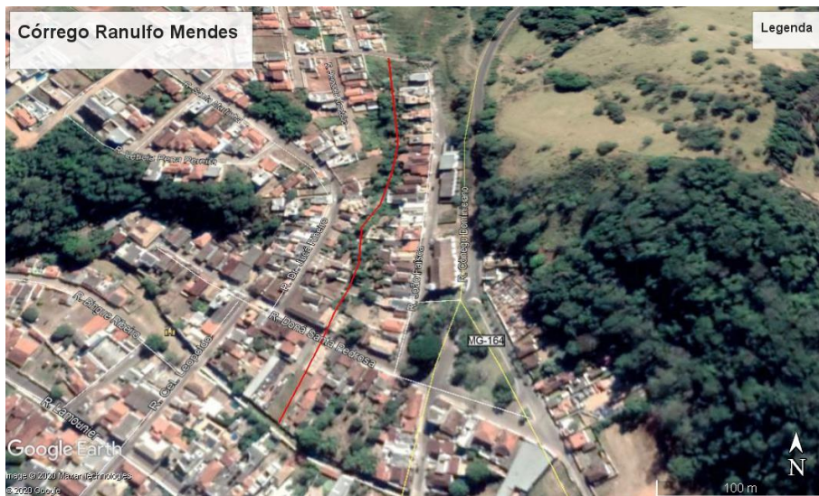
Figura 6 - Trecho do Córrego Ranulfo Mendes.