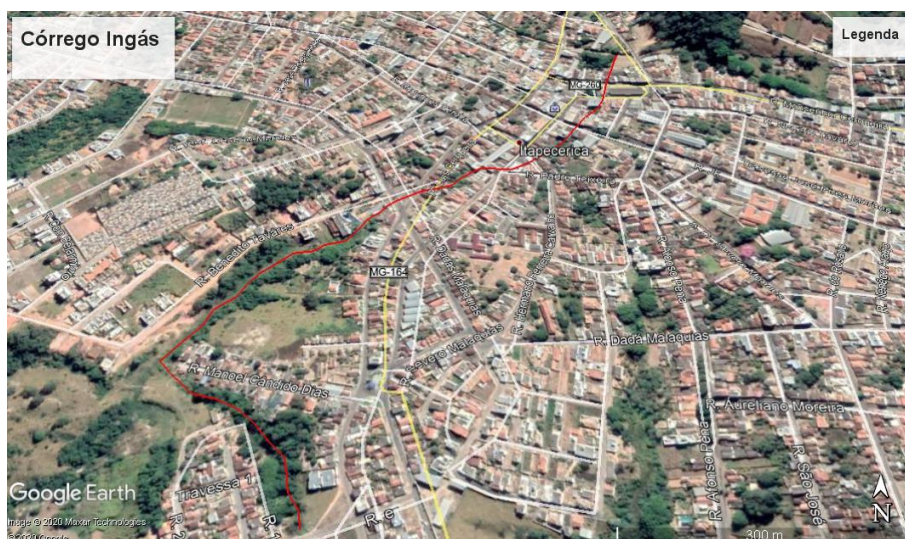
Figura 10 - Trecho do Córrego do Ingás.