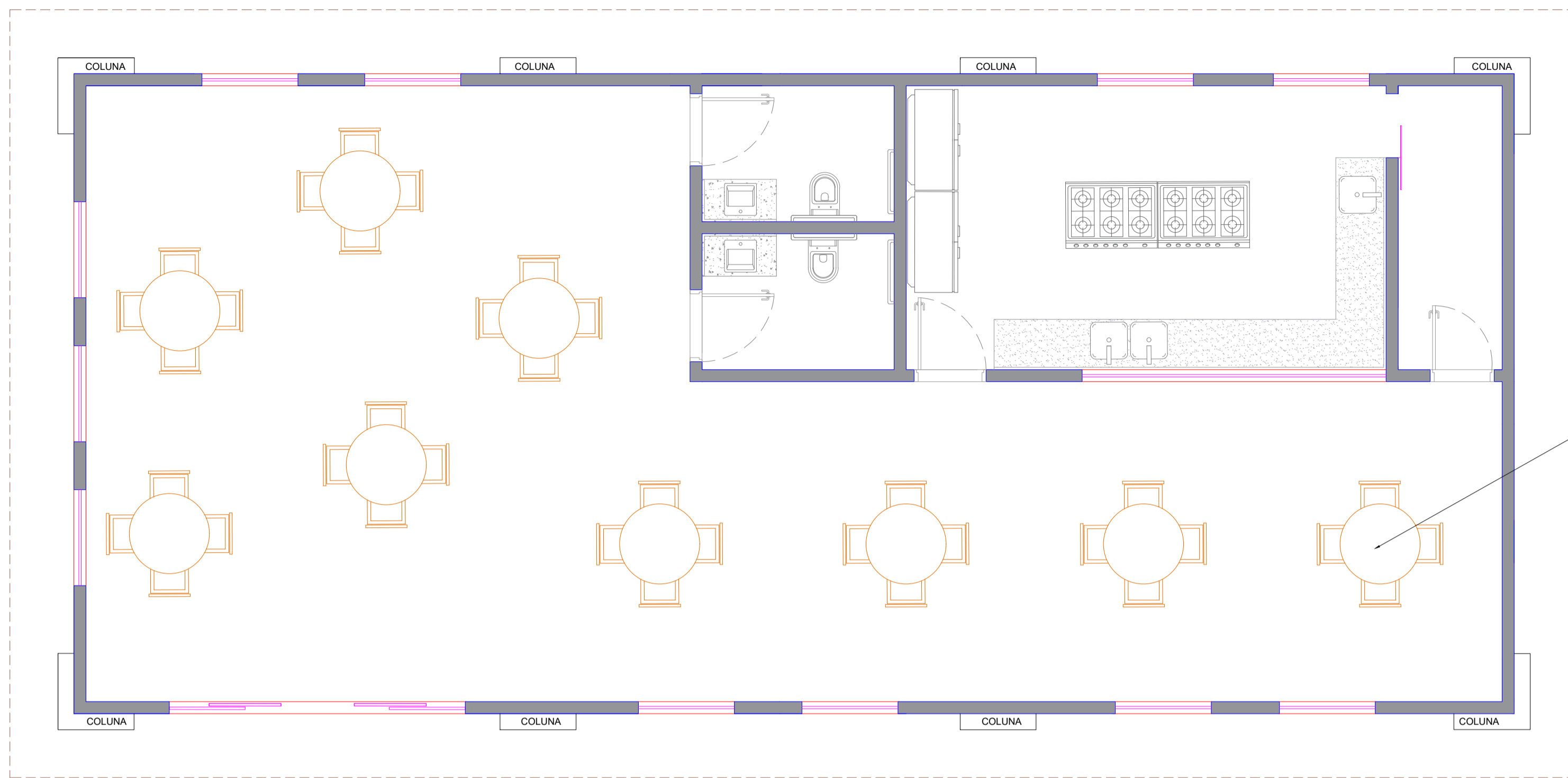
PLANTA BAIXA - MOBILIADA