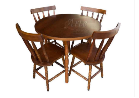
REF. MOBILIÁRIO: MESA REDONDA MESA REDONDA DE MADEIRA