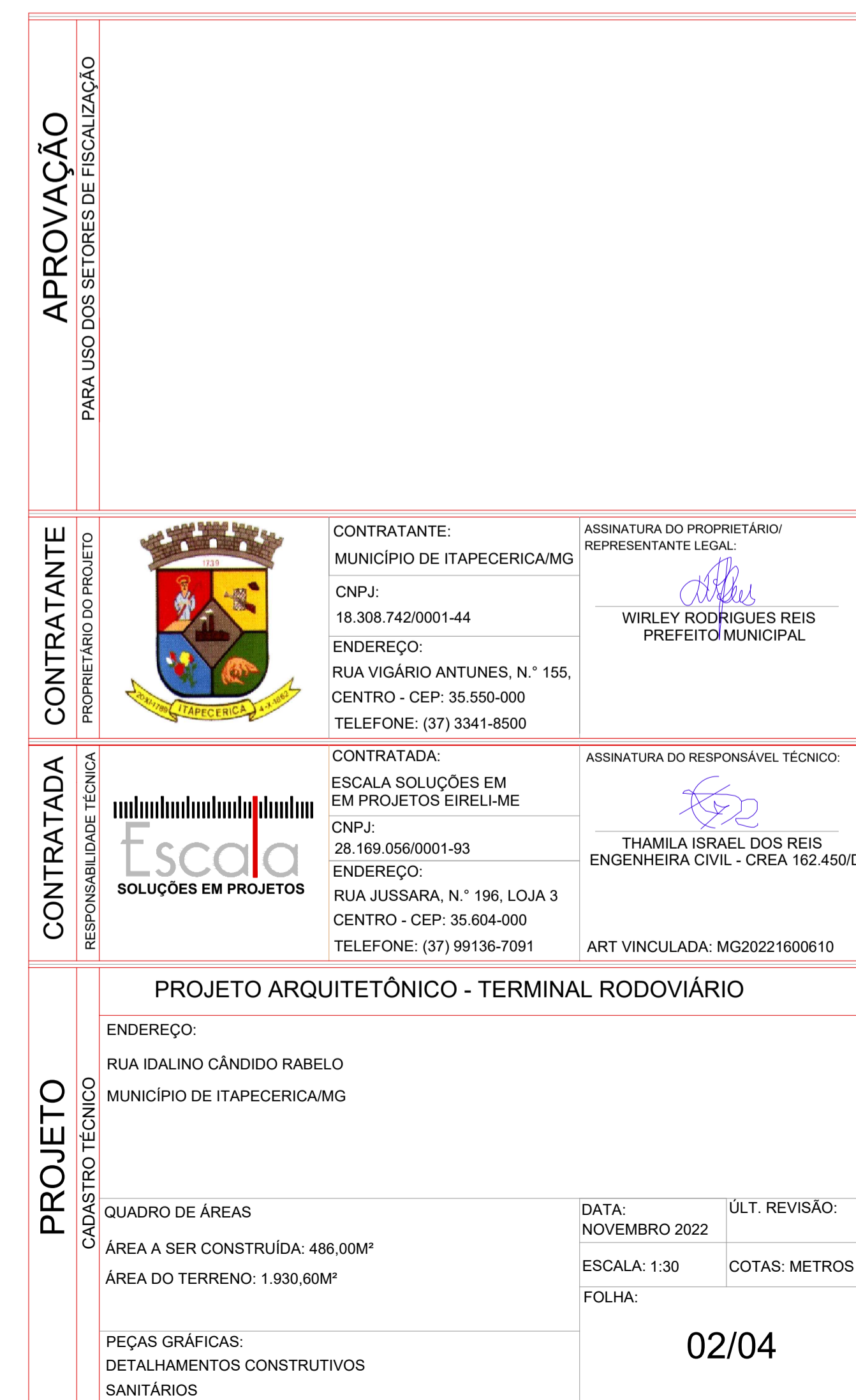
CORTE - DETALHAMENTOS CONSTRUTIVOS SANITÁRIOS ESCALA: 1/30