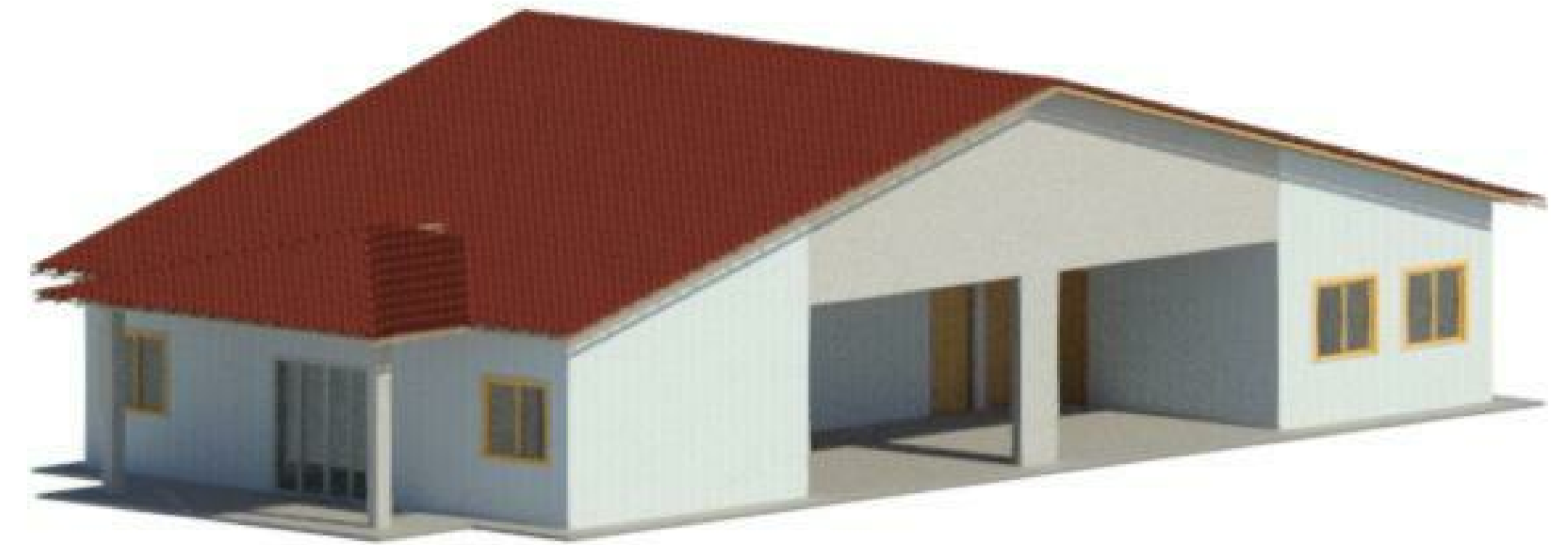
7 ISOMÉTRICO 1 1 : 1