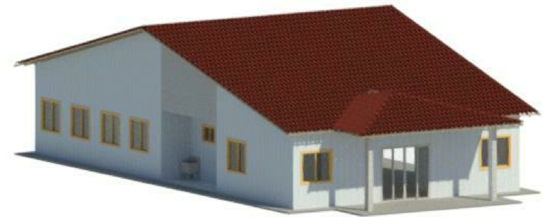
9 ISOMÉTRICO 2 1 : 1