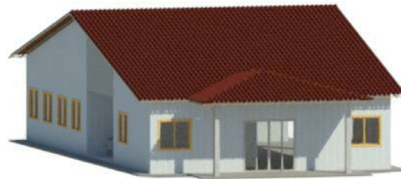
8 ISOMÉTRICO 3 1 : 1