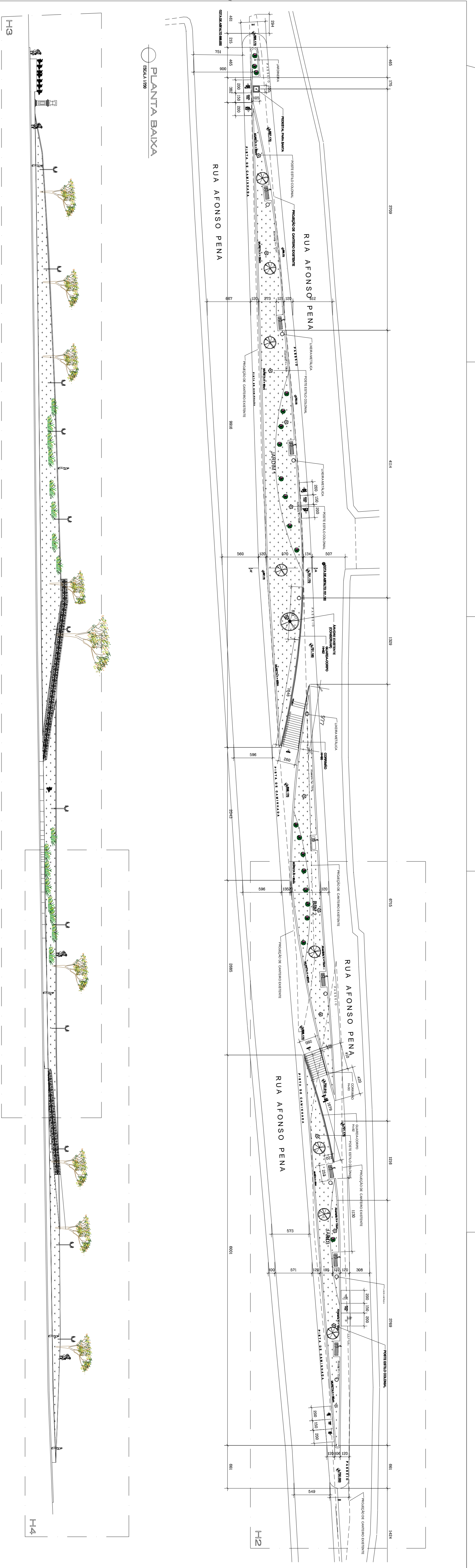
ELEVACÃO FRONTAL ESCALA 1/200