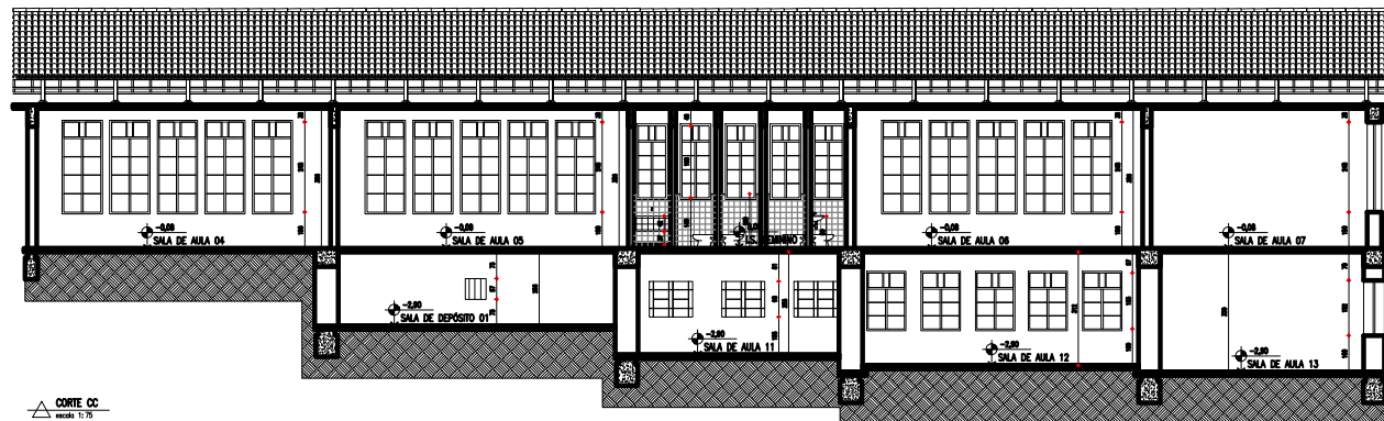
CORTE CC escala 1:75